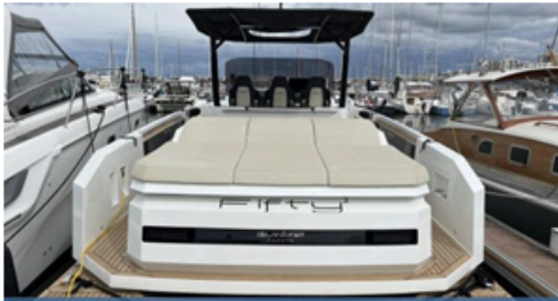
EVASION Importateur Méditerranée / Atlantique De Antonio Yacht