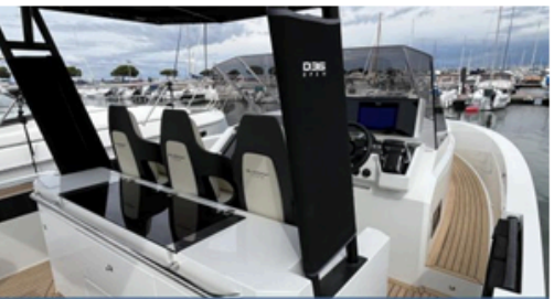
EVASION Importateur Méditerranée / Atlantique De Antonio Yacht