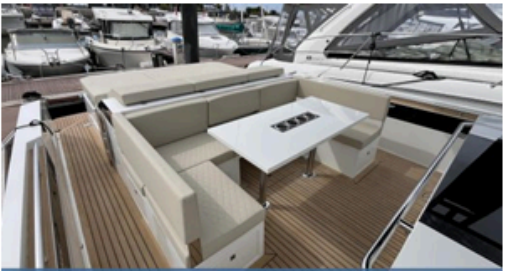
EVASION Importateur Méditerranée / Atlantique De Antonio Yacht