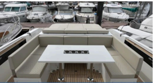
EVASION Importateur Méditerranée / Atlantique De Antonio Yacht