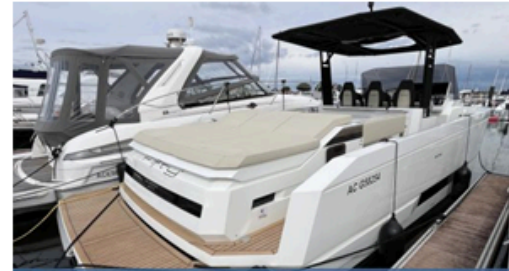
EVASION Importateur Méditerranée / Atlantique De Antonio Yacht