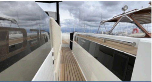
EVASION Importateur Méditerranée / Atlantique De Antonio Yacht