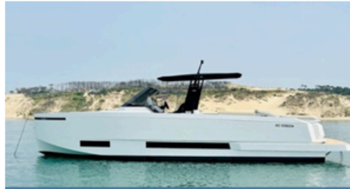
EVASION Importateur Méditerranée / Atlantique De Antonio Yacht