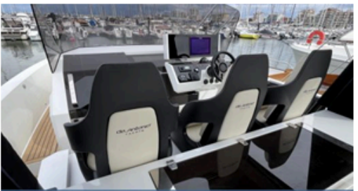
EVASION Importateur Méditerranée / Atlantique De Antonio Yacht