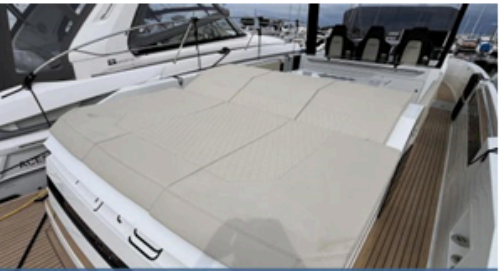
EVASION Importateur Méditerranée / Atlantique De Antonio Yacht