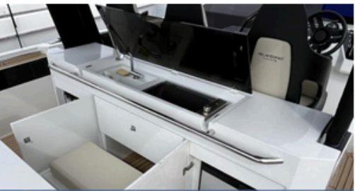
EVASION Importateur Méditerranée / Atlantique De Antonio Yacht