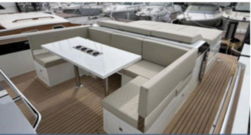
EVASION Importateur Méditerranée / Atlantique De Antonio Yacht