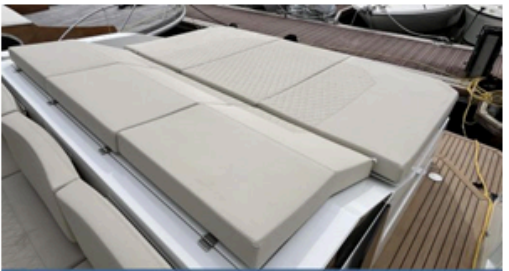
EVASION Importateur Méditerranée / Atlantique De Antonio Yacht