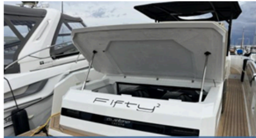
EVASION Importateur Méditerranée / Atlantique De Antonio Yacht