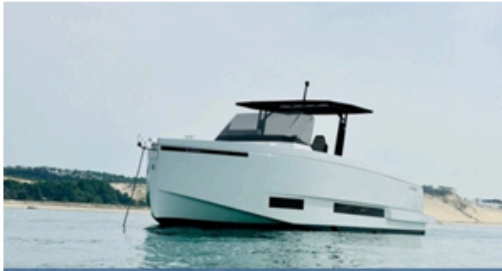
EVASION Importateur Méditerranée / Atlantique De Antonio Yacht